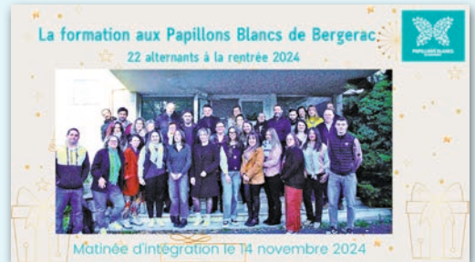
La formation aux Papillons Blancs de Bergerac : 22 alternants à la rentrée 2024

Enfin dans tous les établissements, les professionnels ont accompagné les usagers dans leurs activités sportives et de loisirs : sorties, activités manuelles, séjours. Ils ont fait preuve d'implication et d'investissement au quotidien dans le bien-être des personnes accompagnées. Le combat gagné cette année 2024 pour le Ségur pour tous n'est que la juste récompense de cet engagement au quotidien !