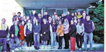
Matinée d'intégration le 14 novembre 2024