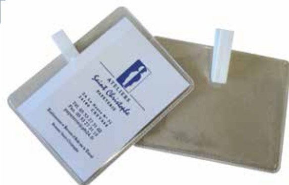
Porte-badges à pince 12 004 . . . . .Dimensions : 90 x 70