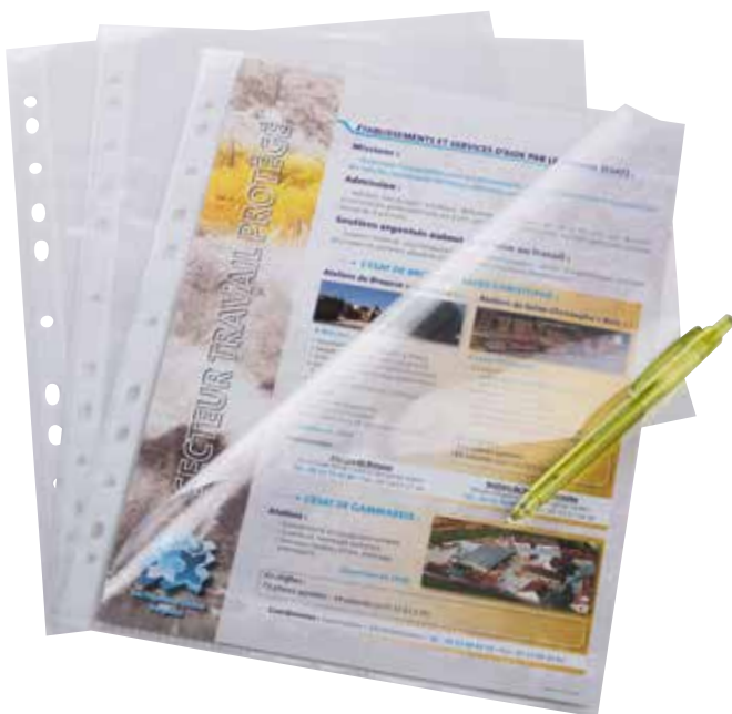
Pochette perforée A4