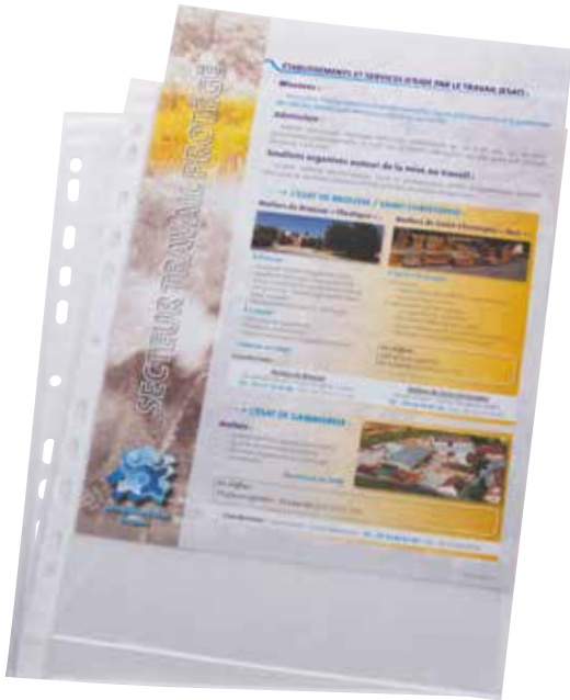
Pochette perforée A4