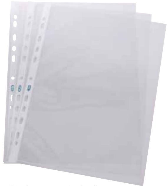
Pochette perforée A4