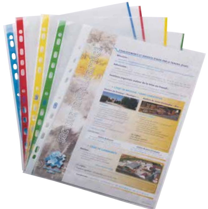
Pochette perforée A4

10 103 . . . . . Ouverte sur 2 côtés • 11 trous