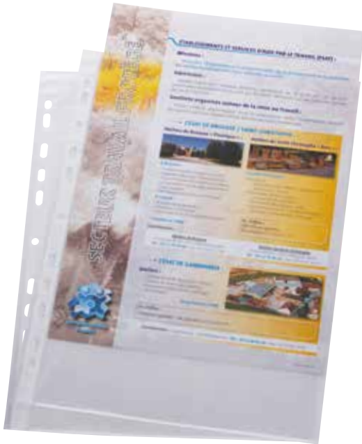
Pochette perforée A4