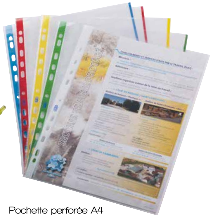
Pochette perforée A4

10 103 . . . . .Ouverte sur 2 côtés • 11 trous