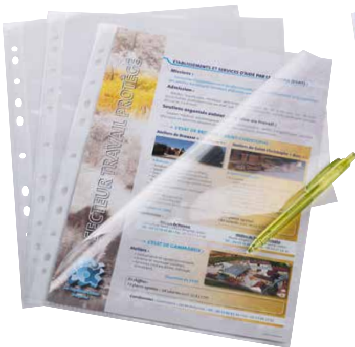
Pochette perforée A4