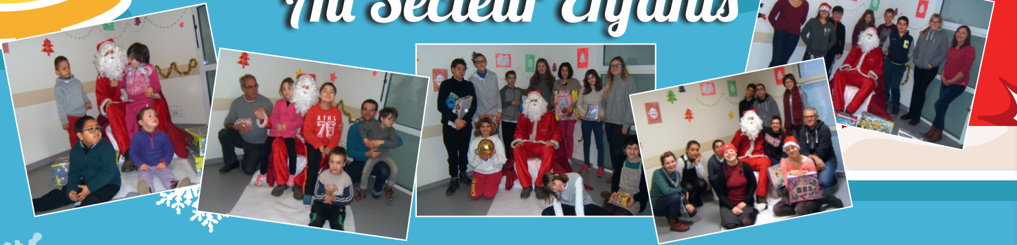
Les groupes de l'IMP et le Père Noël